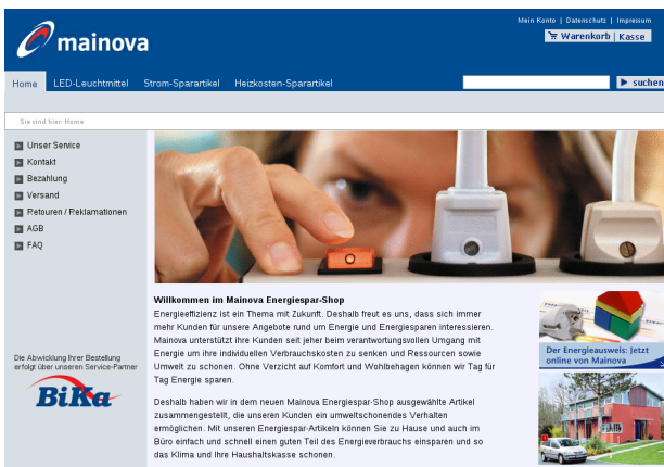
Die Website aus Sicht des Kunden

Sie möchten Ihr Unternehmen und Ihre Produkte im Internet präsentieren und dabei immer aktuell bleiben?